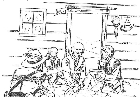
Fig. 1. La habilidad de William Beaumont como médico salvó la vida de Alexis St. Martin. La cirugía proporcionó más tarde la oportunidad única de ver la digestión del alimento en un estómago humano.

El revestimiento del estómago de St. Martin creció finalmente a través de la abertura de la fístula, formando una válvula a prueba de escape, pero la «ventana» de su estómago no se cerró por completo. Quedó un pequeño agujero, lo suficientemente grande como para que Beaumont lo abriera con el dedo índice y mirara directamente